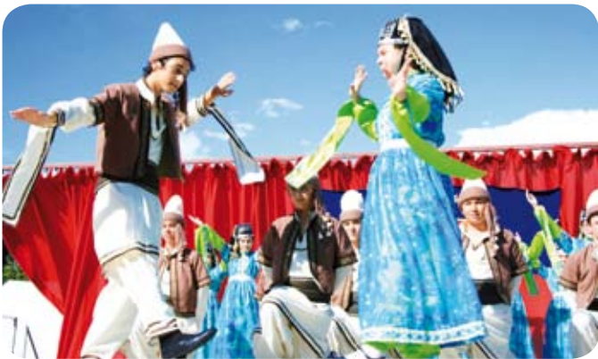
Le groupe Karazog de la ville de Bursa en Turquie

Le dimanche matin, les groupes ont participé à la messe. Puis, ils ont dansé sur la place pour donner un aperçu de leurs folklores. Ensuite, ils ont défilé vers la salle Joseph Pessard pour l'accueil officiel et partager le verre de l'amitié. Le repas animé par les groupes a été servi par des jeunes de la commune. L'après-midi, le festival s'est déroulé au Port Saint-Maur. Les prestations de chaque groupe ont été applaudies chaleureusement.