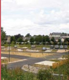
Page 4 - Vie municipale