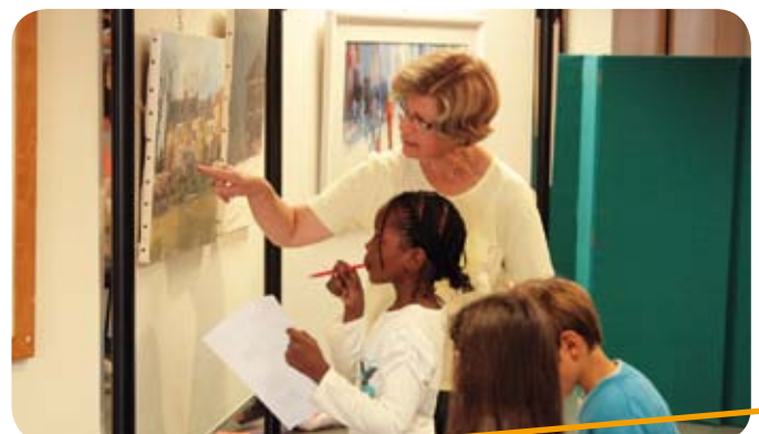
Les élèves des écoles de La Ménitric ont visité le Salon d'art organisé par l'association AACL à l'Espace culturel du 13 juillet au 15 septembre.