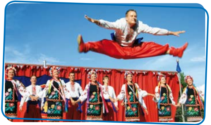
L'ensemble Podillya venu d'Ukraine