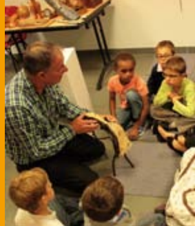
Page 5 - Jeunesse