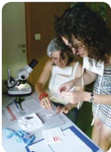
Animation « Menez l'enquête scientifique dans l'habitat »

à Bréhémont de 14h30 à 18h30, salle des séminaires de Loire, à l'occasion d'un forum sur le thème de l'habitat et la santé. Ateliers participatifs avec des artisans, matériauthèque, jeux, spectacle, conseils d'architecte, astuces pour entretenir sa maison tout en soignant sa santé... Tous les moyens seront bons pour y voir plus clair en matière d'habitat et de santé, quel que soit votre projet ! Entrée gratuite.