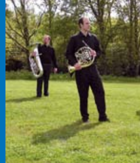
Page 10 - Vie associative