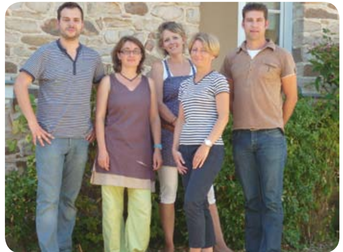
Les professeurs de l'école Sainte-Anne

Voici une année scolaire qui démarre sous un soleil magnifique pour les 88 élèves de l'école Sainte-Anne.