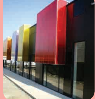
Page 3 - Restaurant scolaire