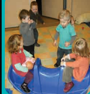
Page 12 - Enfance