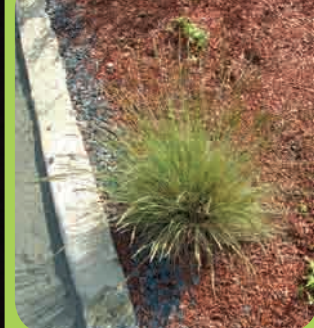
Page 4 - Focus