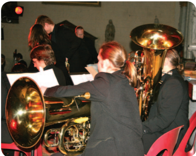
Concert de l'Ensemble Instrumental d'Anjou à l'Église de La Ménitré le 13 février 2011

Réservation à l'Office de Tourisme Vallée Loire-Authion - 02 41 57 01 82 Place Charles Sigogne - St-Mathurin-sur-Loire