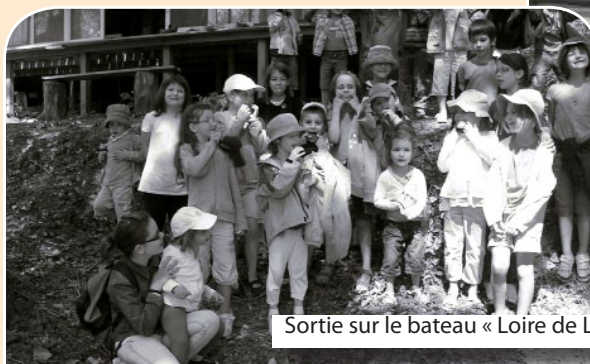
Sortie sur le bateau « Loire de Lumière »