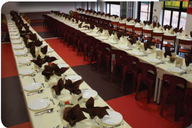
Repas des Anciens Espace Pessard