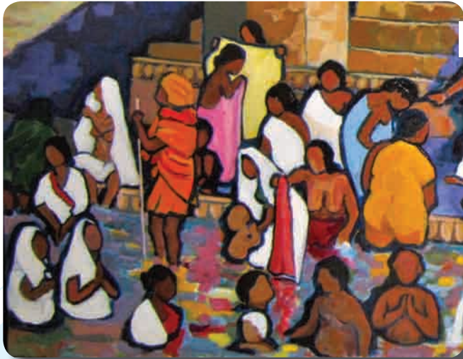
Salon d'Art 2011