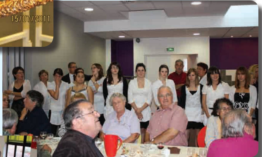
Les bénévoles du Repas des Anciens Octobre 2011