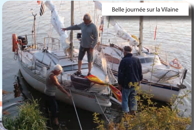
Belle journée sur la Vilaine