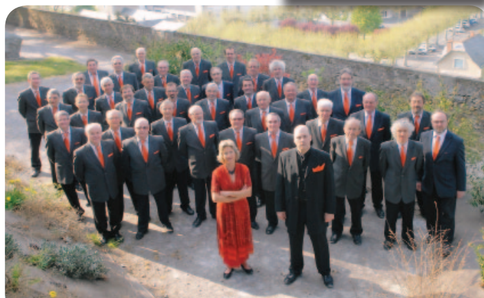
Choeurs d'Hommes d'Anjou

Les dates des 5 concerts de l'année sont déjà arrêtées. Ils débiteront, le 29 janvier par un concert de Gospel féminin « Happy Voices ». Cette année encore, l'association a essayé de jouer la carte de la diversité, en passant du chant choral à la musique. L'association réserve de belles surprises pour cette année musicale 2012. Le détail de ce programme sera dévoilé lors de l'assemblée générale le 12 Janvier 2012 à 20h30 à l'Espace Pelé. Les Amis des Orgues vous y attendront nombreux.