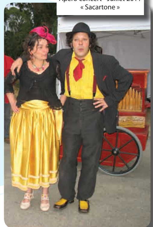
Apéro concert - Juillet 2011 « Sacartone »