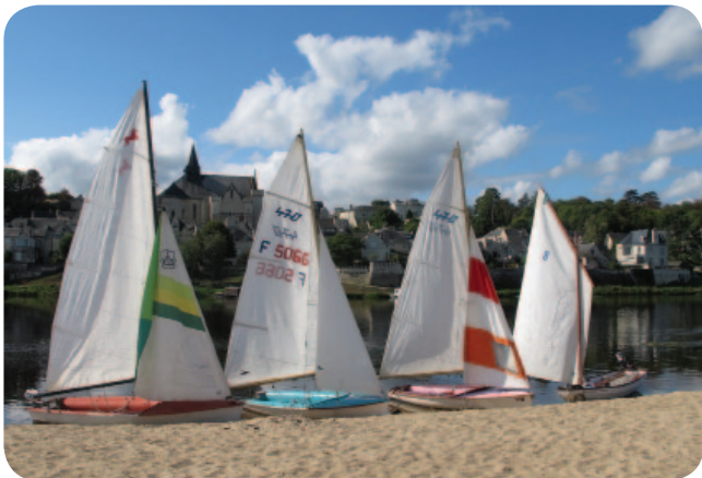
Bateaux en face Candès St Martin

Les sorties sur semaine - Le lundi et le jeudi de deux à cinq bateaux naviguent sur le plan d'eau du port Saint Maur. Lorsque le vent est de secteur sud ou est nous mettons à l'eau les dériveurs à la cale de Gennes. Durant les mois d'hiver profitant du niveau élevé du fleuve quelques sorties motorisées ont permis de naviguer parmi les îles en particulier vers Cunault. De même profitant de belles journées quelques navigations nous ont conduit vers Gennes avec à midi un pique nique sur la plage. Ou en septembre à la confluence de la Vienne.