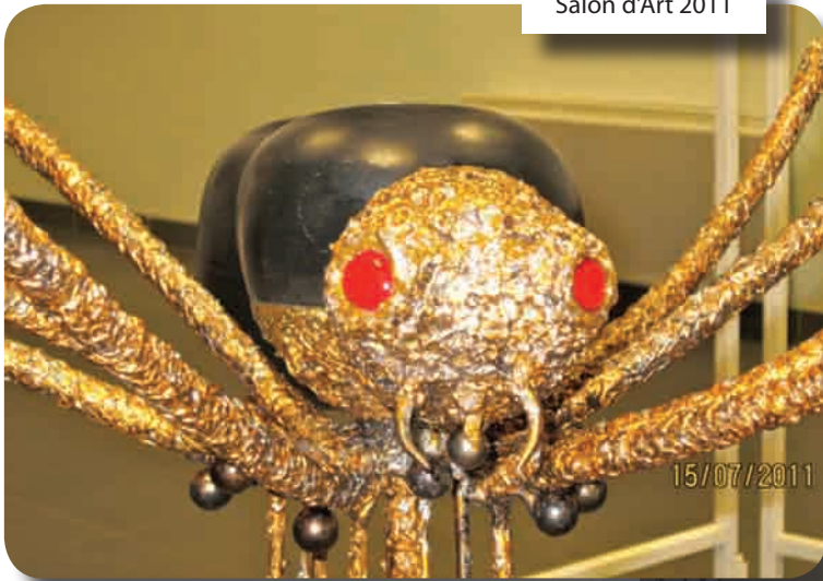
Salon d'Art 2011