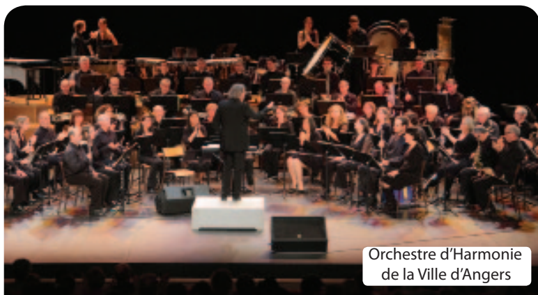
Orchestre d'Harmonie de la Ville d'Angers

L'année musicale s'est terminée par un concert de musique avec l'Orchestre d'Harmonie de la Ville d'Angers et ses 60 musiciens. Leur répertoire très varié nous a emmené de PACHELBEL à RACHMANINOV. Le dimanche matin, ils ont accepté de faire découvrir leurs instruments aux enfants de La Ménittré.