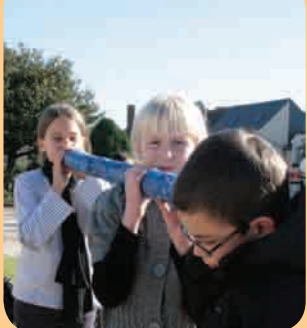
Page 4 - Jeunesse