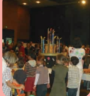
P. 16 - Vie intercommunale