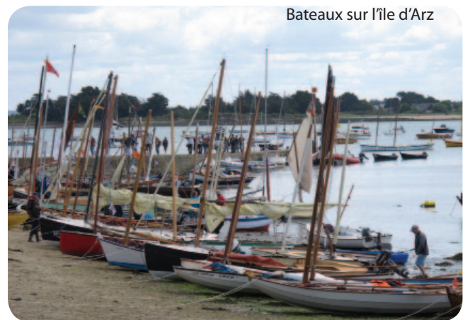
Bateaux sur l'île d'Arz

A certains endroits le nombre de bateaux obligés de tirer des bords rendait même la situation périlleuse ! Le soir dans chaque port repas des équipages, concerts, danses.