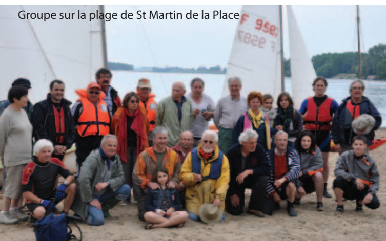
Groupe sur la plage de St Martin de la Place