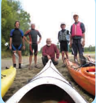
Page 10 - Vie associative