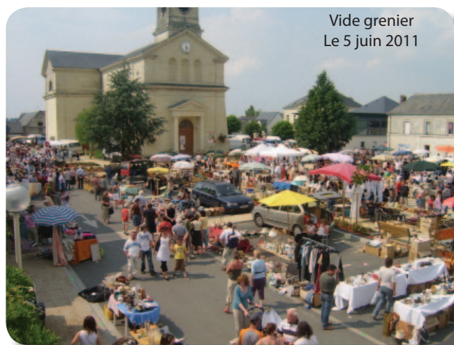
Vide grenier Le 5 juin 2011

L'association a décidé d'offrir cette année des chocolats à tous les enfants des écoles de La Ménittré avec le passage du Père Noël dans les classes.