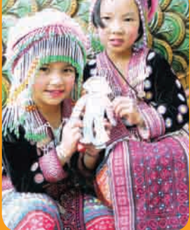
Page 4 - Jeunesse