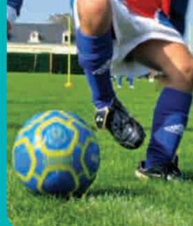
Page 9 - Vie associative