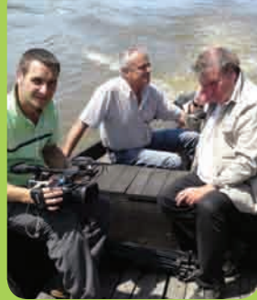
Page 6-7 - Portrait