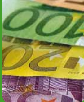
Page 6 -Budget communal