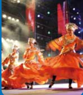
Page 5 - Vie associative