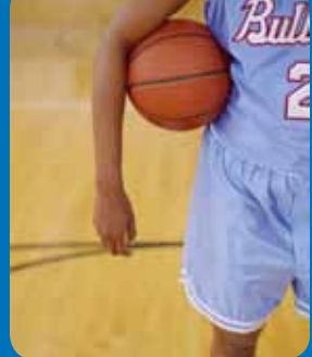
Page 8-9 - Vie associative