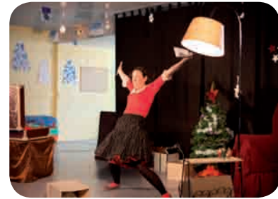
Spectacle « Noël dans ma valise » de la compagnie Mendigot

Les inscriptions en toute petite section et petite section sont ouvertes jusqu'à fin juin. Prenez rendez-vous au 02 41 45 66 82 ou sur le site de l'école http://justfredf.wix.com/ecolepierreperret , rubrique « nous contacter ».