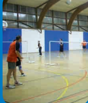
Page 10 - Vie associative