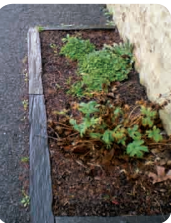
Pied de mur rue du Roi René

Dans le but de rendre plus agréable la rue Marc Leclerc, des réserves de terre seront installées en pied de mur afin de planter des vivaces, des graminées... le même type de fleurs que dans la rue du roi René. Des aménagements seront également réalisés dans cette rue, du rond-point à la rue des Plantagenêts. « Des charmes situés sur l'îlot central seront rabattus afin de sécuriser les sorties de véhicules », explique Vincent Fourneret, adjoint aux espaces verts. « Des poteaux de protection seront installés pour sécuriser les piétons ainsi que les cyclistes et interdire aux voitures de stationner. » Un aménagement simple sera réalisé pour embellir l'entrée du bourg. Quant au parking de la gare, il ouvrira au printemps afin de permettre une bonne implantation du gazon.