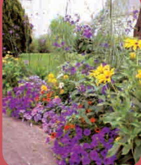
Page 4 - Vie municipale