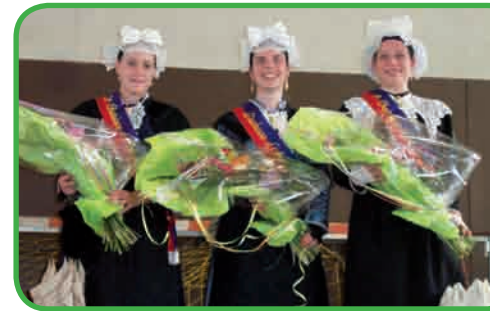
Dernière élection de la Duchesse d'Anjou et de ses deux Châtelaines

« Quelques animations ont disparu. Dans les années 80, un défilé partant de la place de l'église permettait aux groupes et aux visiteurs de se rendre au Port Saint-Maur. Un concours de rimiaux - poèmes en patois - avait lieu au cours de cette Assemblée, de même que l'élection de la Duchesse d'Anjou et de ses deux Châtelaines. Leur rôle était de représenter l'Anjou dans les différentes provinces françaises pendant un an. L'élection s'est éteinte en 2005 par manque de candidates. »