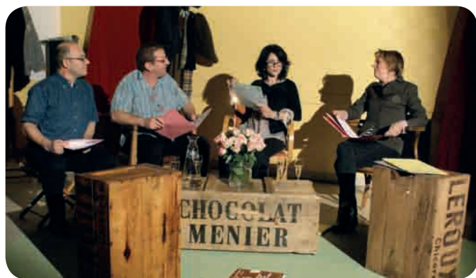
La compagnie Mascartade Théâtre

■ samedi 6 avril à 20h30 à l'Espace culturel : la compagnie Mascartade Théâtre de Brain Andard revient à La Ménitré et propose des extraits d'une pièce de Catherine Anne, « Comédies tragiques ».