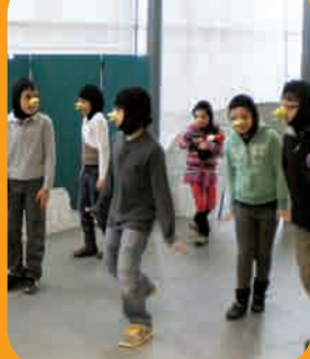
Page 5 - Jeunesse