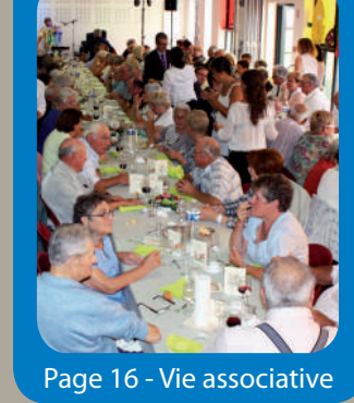
Page 16 - Vie associative