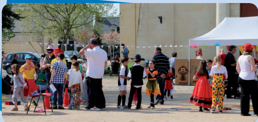
Carnaval sur le thème du cirque organisé par l'APE des écoles publiques le 12 avril. Défilé costumé suivi d'un après-midi jeux