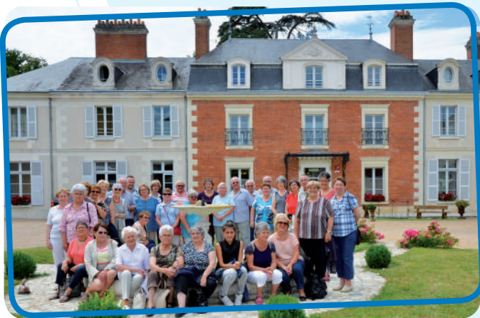
Visite des jardins du Domaine de Chaumont-sur-Loire