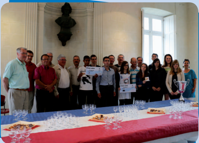
Des jeunes sportifs ménitréens récompensés par la commune pour leurs excellents résultats de la saison 2013-2014