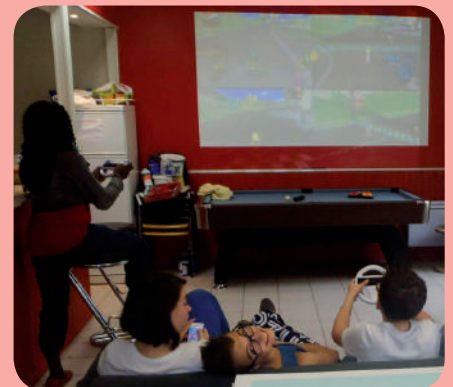
Soirée jeux vidéo - vacances d'automne

Contact : Adeline Boulissière, animatrice de l'espace jeunesse de La Ménitricé - 09 72 27 17 41 - www.aidal.fr