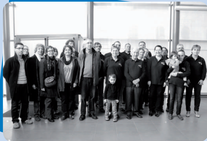
Une initiative saluée de tous ! L'ADAM a donné un chèque de 400 € à LirenLoire suite à leurs bénéfices du vide-greniers d'août.