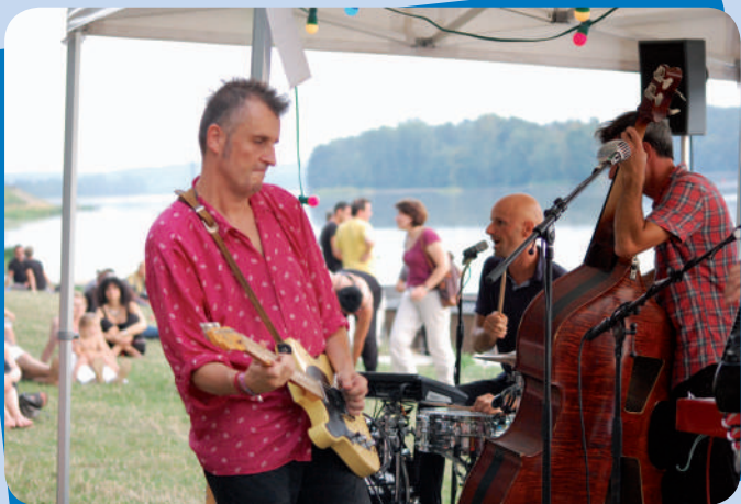
Apéro concert le 18 juillet au port Saint-Maur avec le groupe Ma Valise devant un public de 450 personnes