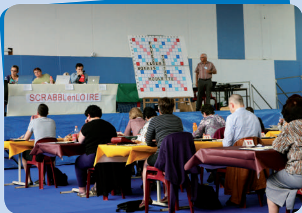
Championnat régional de scrabble organisé le 13 avril par ScrabblenLoire