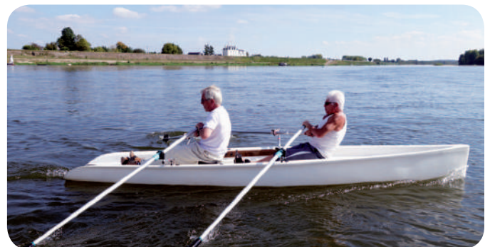
Yole avec deux rameurs

Divers - Depuis l'automne, le club s'est doté d'une yole à une ou deux places permettant de pratiquer l'aviron les jours où le vent fait défaut.