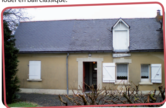
La Clé des champs, située rue de la Croix des bas

Le taux d'occupation des gîtes communaux a été médiocre pour les mois estivaux. De juin à septembre, le nombre de nuitées a diminué de près de 40 % depuis 2012. Face à la baisse de fréquentation des gîtes et au bilan financier de ce service tout juste équilibré, le Conseil municipal a décidé de retirer la maison « La Clé des champs » du parc des gîtes communaux et de la louer en bail classique.