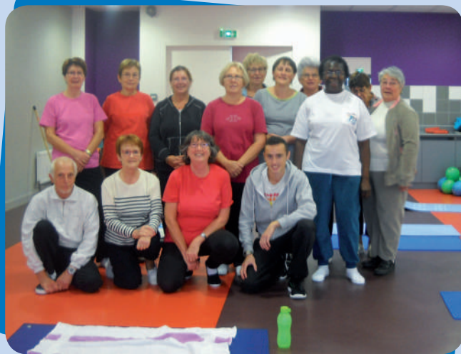
Gym douce, activité proposée par ALES