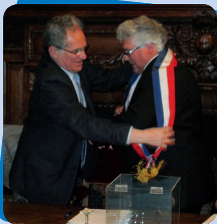
Élection du maire le 28 mars