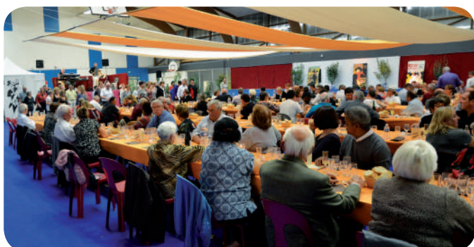
La salle Joseph Pessard totalement relookée en salle de spectacle

■ Soirée spectacle le 19 octobre - C'est autour d'un couscous que les participants ont apprécié le spectacle avec à l'affiche : l'humoriste atypique Ptibeunoi, l'artiste magicien Denis Dickson avec la complicité des enfants présents et l'orchestre Christian Ouvrard pour la danse.