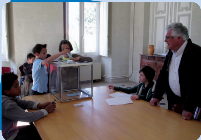
Élection des délégués de classe de l'école Maurice Genevoix le 15 avril