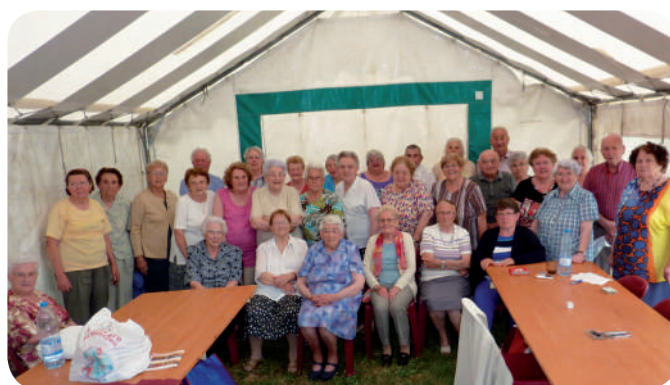
Pique-nique du 26 mai au port Saint-Maur

Comme tous les ans, le club de l'amitié se réunit à la mi-décembre pour le repas de Noël, suivi d'un après-midi jeux (belote, loto...) à l'Espace Pelé. La date de l'assemblée générale en janvier n'est pas encore définie.