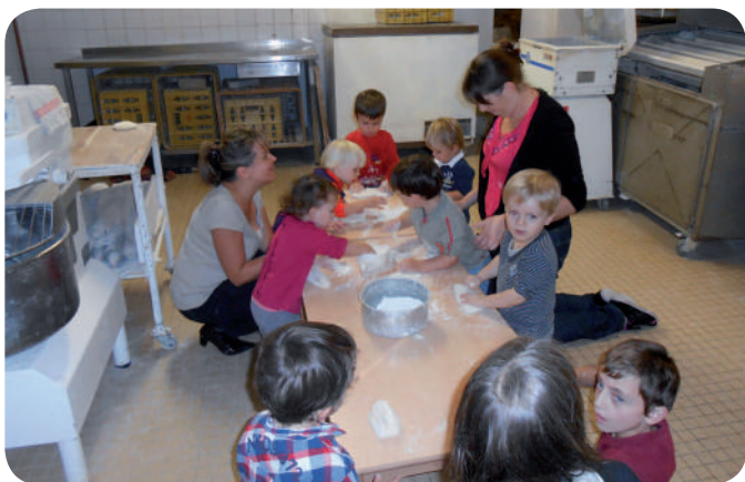
Pétrissage du pain à la boulangerie Maugin

■ Cinq sorties ont été organisées autour du goût : pétrissage du pain et secrets de fabrication lors d'une matinée à la boulangerie Maugin à La Méniltré ; vendanges et présentation des engins au Domaine de Tartifume à Coutures ; cueillette et dégustation de pommes au verger de La Maison Blanche à Jumelles ; découverte des vaches et dégustation de préparations à base de lait à La ferme des Peux à Longué ; découverte des champs de fraises, choux, épinards et pique-nique au Champ libre à La Méniltré.