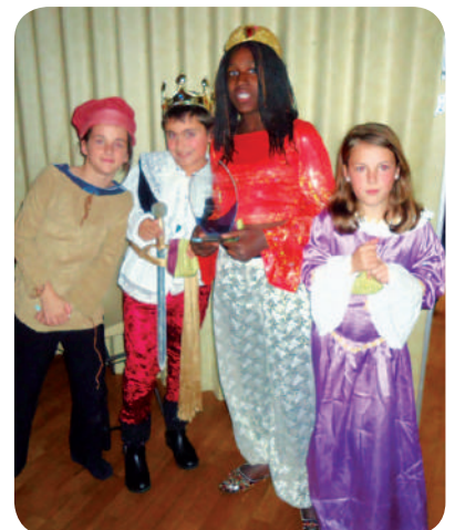
Une partie du groupe de comédiens