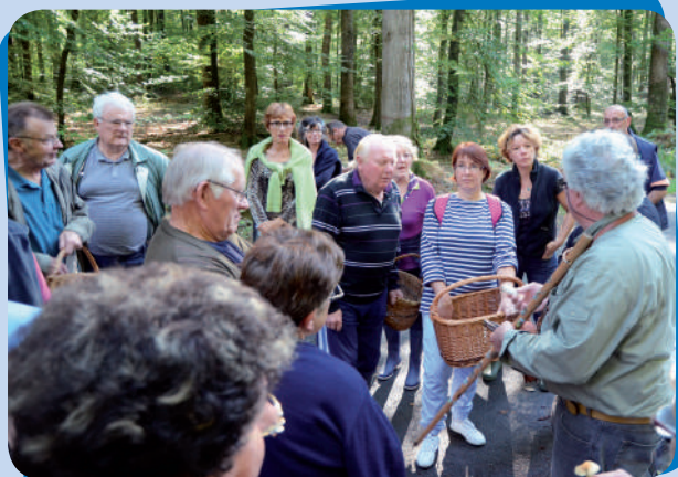
AACL - Sortie champignons le 19 octobre dans la forêt de Chandelais