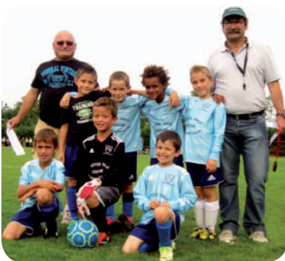
L'équipe des U9

La passion seule ne suffit pas à maintenir un tel engagement dans la durée. Aujourd'hui, les clubs se doivent d'offrir un cadre propice à la convivialité, améliorer leurs structures et surtout amener des projets porteurs pour mobiliser et fidéliser. La labellisation de l'école de foot est un exemple et la demande a été faite auprès des instances pour validation. Le verdict sera rendu en fin de saison. Dans ce même esprit, le club s'est engagé dans le « programme éducatif fédéral » aux côtés de la FFF. Cette démarche est construite autour de la notion centrale de respect pour que, dans l'enceinte du club, se développe un véritable projet collectif articulé autour des valeurs de citoyenneté, de droiture et de solidarité portés par le football. Demain, le club ambitionne de se positionner comme un relais de cette philosophie.