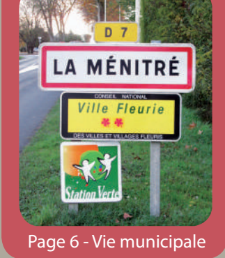
Page 6 - Vie municipale