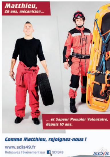
Affiche visible sur www.sdis49.fr

Depuis le mois de janvier, le Service Départemental d'Incendie et de Secours (SDIS) du Maine-et-Loire a lancé une campagne de communication dédiée au recrutement de sapeurs-pompiers volontaires. L'objectif de cette opération est d'attirer de nouvelles recrues dans les rangs des sapeurs-pompiers.