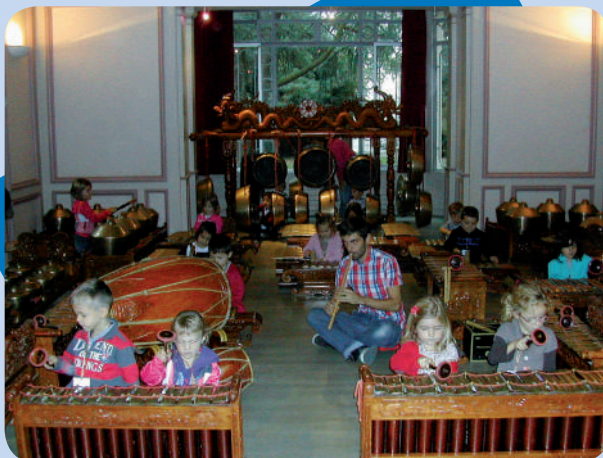
Découverte des percussions du monde à la Galerie sonore par les élèves de l'école Pierre Perret