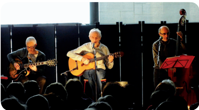
Concert de Croc-Notes Trio en mars dernier à l'Espace culturel

Autre volet de l'action de LirenLoire : les animations occasionnelles en direction des enfants et des adultes, avec le souci constant de la variété et de la qualité : soit une quinzaine de rendez-vous pour l'année (théâtre, spectacles, contes, lectures, expositions, chansons...).