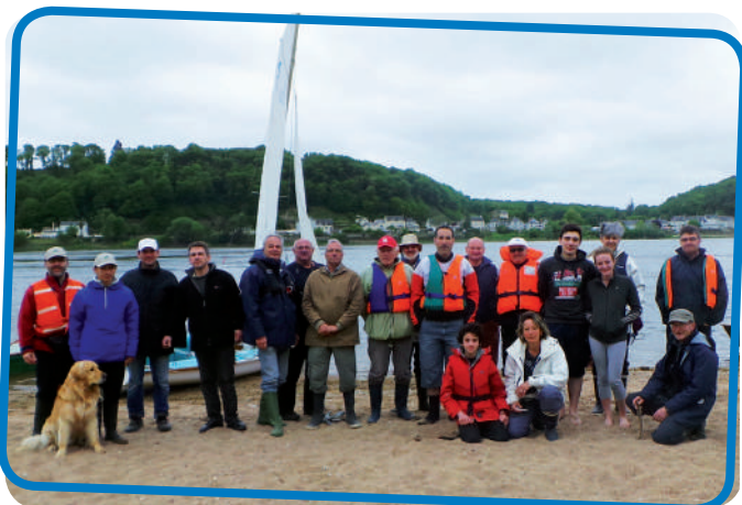
Escale à Saint-Martin-de-la-Place

■ 8 mai - Descente annuelle du 1 er mai reportée comme l'an dernier à ce jour en raison de la pluie : Saumur - La Ménitrie. Trois dériveurs sur l'eau, deux bateaux à moteur, deux canoës. Escale à midi sur l'île de Cunault. Bon vent de sud-ouest mais temps maussade.