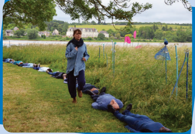
Mystère de Loire au port Saint-Maur le 31 mai