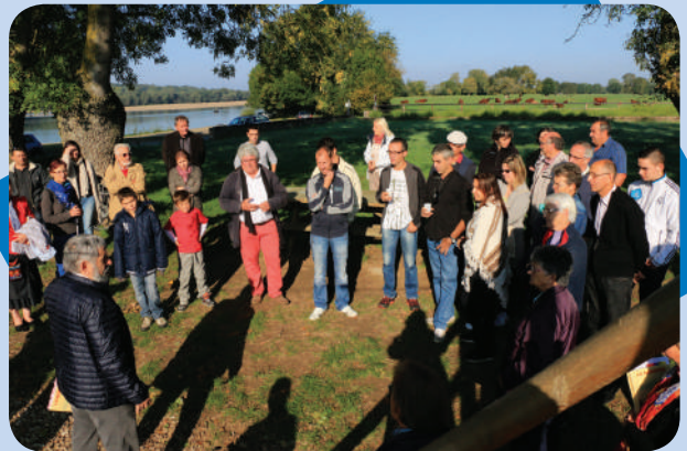
Visite de la commune lors des Journées du patrimoine le 20 septembre