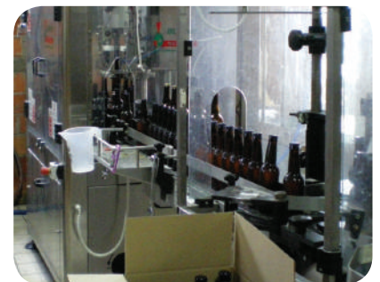
La Fabrique des Bières d'Anjou

L'édition 2016 de Made in Angers se déroulera du 1 er au 26 février. Pendant cette période, près de 150 entreprises - dont la Fabrique des Bières d'Anjou à La Ménitrie - ouvriront leurs portes à un public curieux de découvrir les savoir-faire locaux. Réservations auprès d'Angers Loire Tourisme.