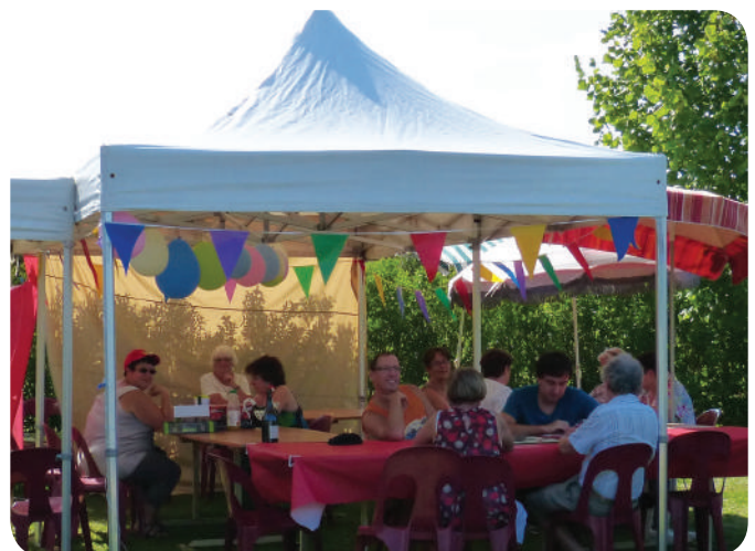
Journée festive du 29 août dernier

Contact : Christine Rousseau 02 41 45 69 27 ou par mail cdarourou@neuf.fr