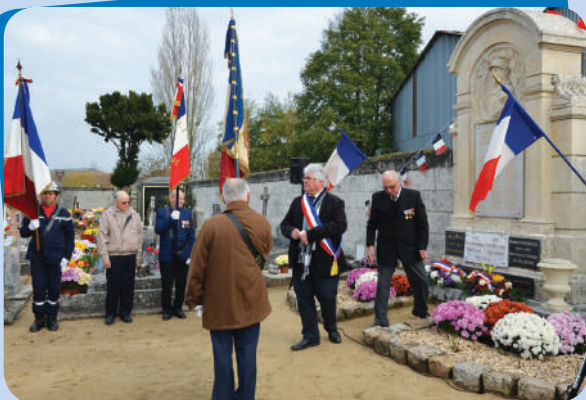
Commémoration du 11 novembre 1918