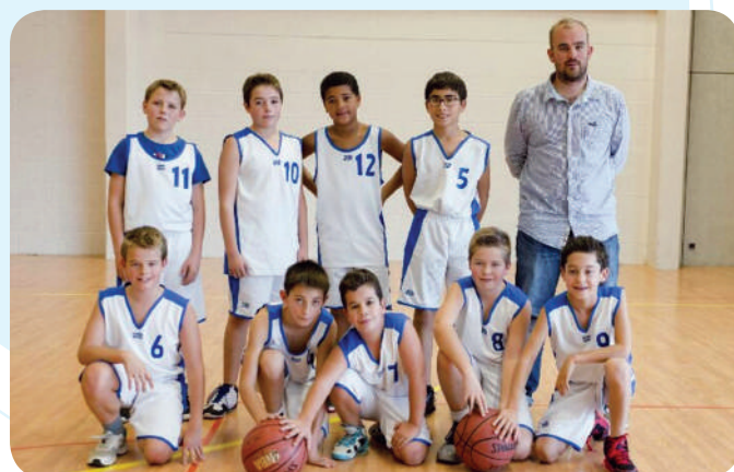
L'équipe U13 garçons