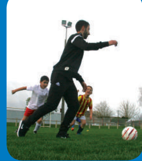
Page 14 - Vie associative