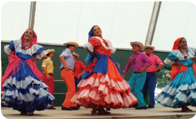
Ballet Folclorico Nacional du Salvador

La soirée du 25 juillet était animée par l'orchestre d'Aurélie Garnier. Le groupe de l'Équateur a été accueilli dans les familles dès le vendredi soir. Le groupe des Landais est arrivé le samedi midi. Le samedi soir, ces deux groupes ont présenté quelques danses, après être allés dans les foyers logements des Rosiers et de Bauné. Le feu d'artifice a été offert par la commune de La Ménittré. Les nombreux spectateurs se sont installés sur les bords de la Loire, puis ont continué à danser sur la prairie.