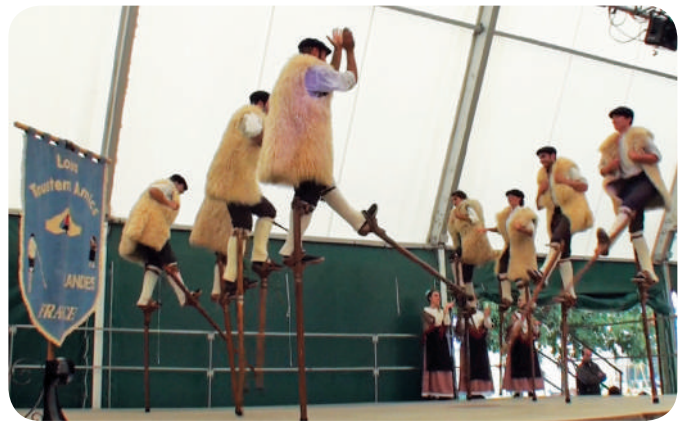
Lous toustem amics, groupe folklorique des Landes