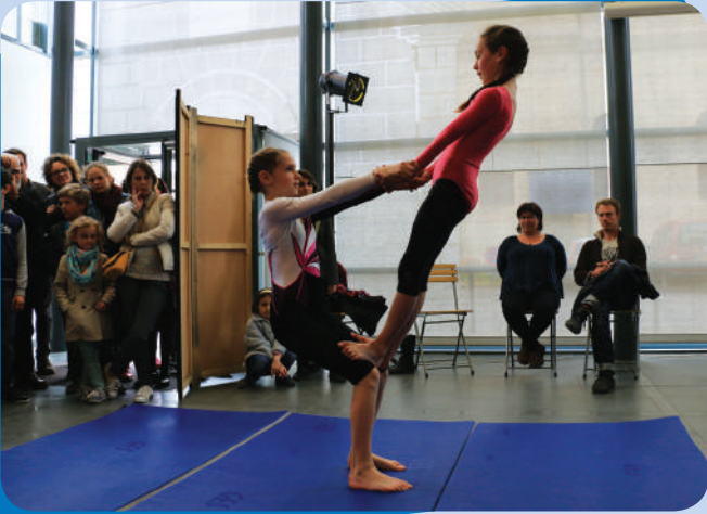
Le Printemps des Talents les 11 et 12 avril