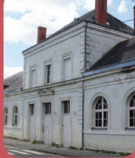
Page 6 - Vie municipale