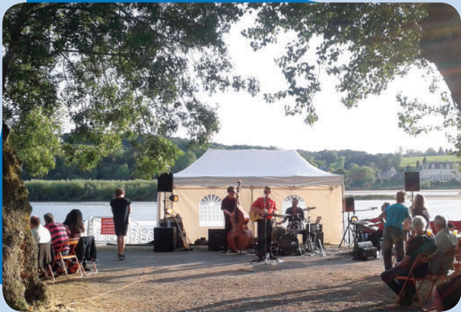
Apéro concert du 7 août avec le groupe Stabar