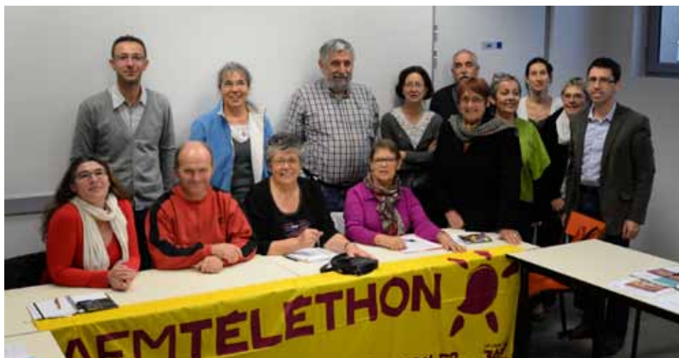
Merci à tous les bénévoles pour leur engagement pour le Téléthon

Judi 1er décembre, le CLUB DE L'AMITIÉ demanda à chaque joueur des parties de cartes et jeux de