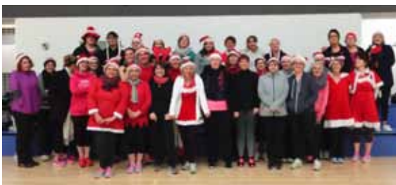
Pour le dernier cours de zumba avant les vacances de Noël, les adhérents étaient déguisés en père Noël

A cet effet, l'association a renouvelé le matériel nécessaire à cette activité.