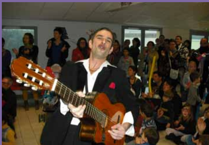
Anniversaire festif pour les 10 ans du multi accueil et les 15 ans du RAM en décembre dernier.

Les vendredis de 13 h 00 à 14 h 30 - Sur rendez-vous.