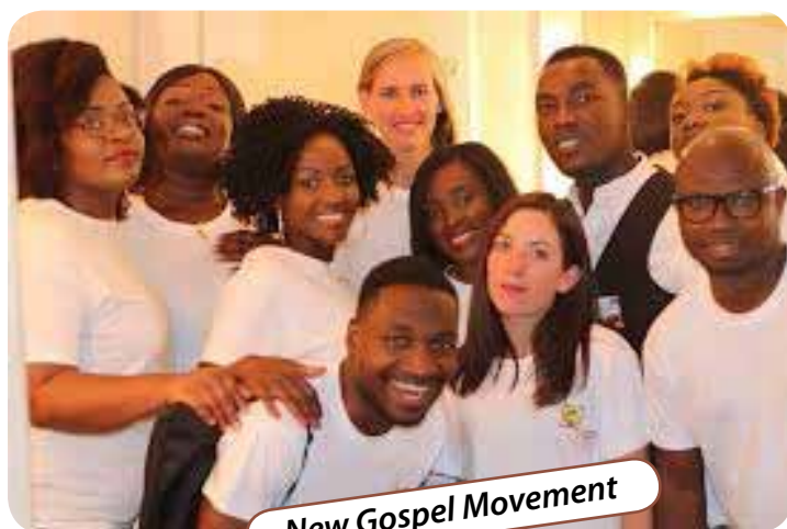
New Gospel Movement

Quatre musiciens, amateurs et professionnels, accompagnés d'une dizaine de choristes interpréteront cantiques et musique moderne nés chez les esclaves noirs des États-Unis dans les champs de coton. Leur prestation remporte toujours un beau succès grâce à leur dynamisme et à la qualité de l'ensemble musique et voix.