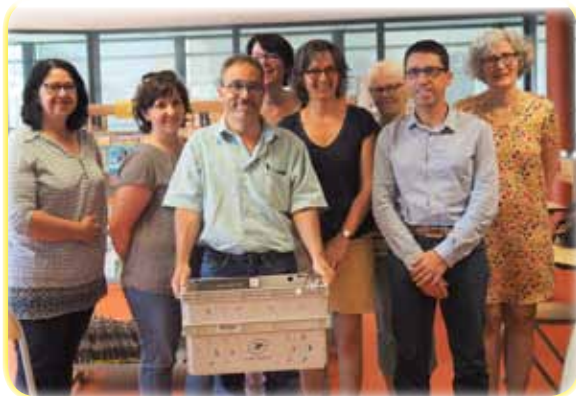
Point presse service navette à la médiathèque

Elle est assurée par La Poste tous les 15 jours.