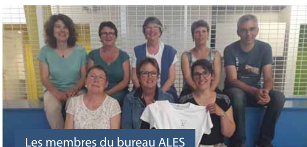
Les membres du bureau ALES

Pour toute information, vous pouvez nous joindre par mail : ales.asso@laposte.net