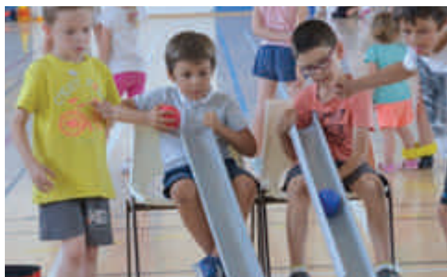
Atelier découverte la Boccia, pétanque en position assise...