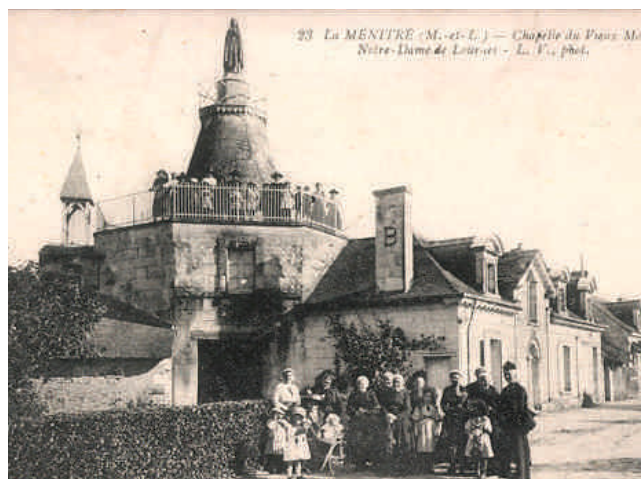
Le moulin de la Vierge dans les années 20

C'est alors qu'une association locale existante, qui depuis a pris le nom de « ASSOCIATION MOULIN et CULTURE DE LA VALLÉE » s'est vue confiée la propriété de ce site. Après étude et concertation, les responsables décidèrent d'entreprendre la réhabilitation de ce bâtiment. Une première tranche de travaux comprenant notamment la rénovation des façades et la réfection de l'escalier extérieur fut réalisée en 2013. La logique veut que le projet soit mené à son terme. C'est la raison pour laquelle l'association envisage désormais la réfection et l'aménagement des deux salles avec si possible une reproduction des peintures murales sur les voûtes de la chapelle.