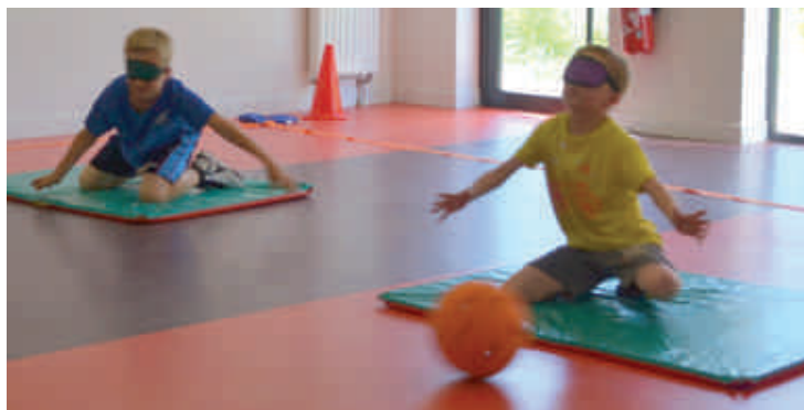
Ou encore du torball : football pour les non-voyants...

Cette journée fut riche en découverte et les enfants ont pris conscience qu'il est possible de faire du sport même avec un handicap.