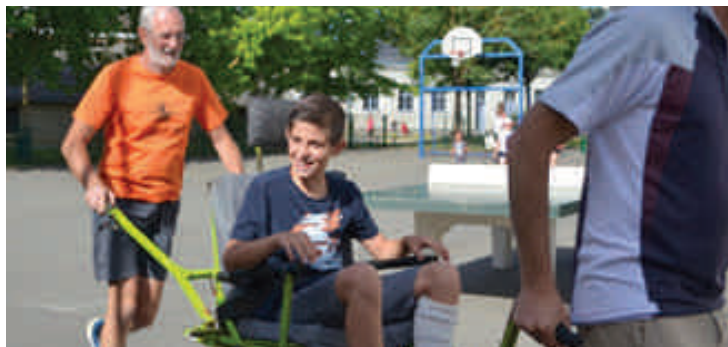
Et l'occasion pour certains élèves blessés de participer au cross solidaire en « joëlette », fauteuil de randonnée pour personne à mobilité réduite.