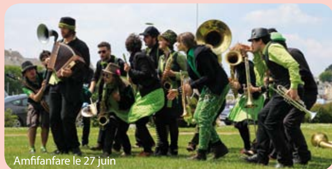
Amfifanfare le 27 juin

Nouvelle édition, groupes inédits. Rendez-vous les 27 juin, 18 juillet et 8 août à 19h30 au Port Saint-Maur pour les apéros concerts organisés par la commune. Ambiance garantie !