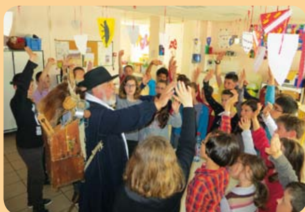
Jacques le Colporteur a échangé autour du Québec avec les CM1 et CM2 dans le cadre de la Biennale des Grands Fleuves

La fin de l'année approche à grands pas pour les écoliers de Maurice Genevoix. Les différentes classes vont achever les projets qui auront rythmé l'année. Les CM ont exposé leurs travaux autour de la Loire et du Saint-Laurent lors