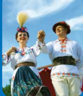
Page 12 - Vie associative