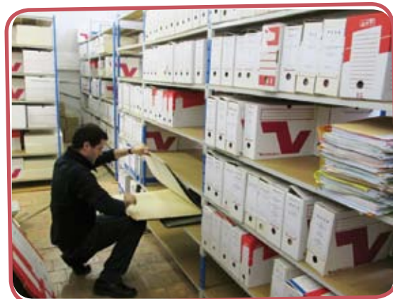
La plus vieille archive : un registre d'état-civil de 1824

Elles constituent l'Histoire de la commune, une sauvegarde indispensable du patrimoine local. Les archives sont consultables par exemple pour des recherches généalogiques. Elles servent également de références pour le personnel communal qui en a parfois besoin pour établir certains dossiers.