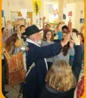
Page 6 - Jeunesse