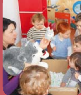
Page 14 - Vie interco