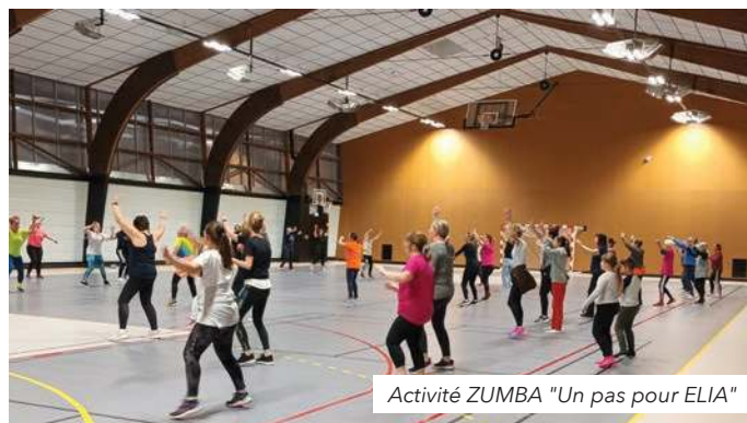
Activité ZUMBA "Un pas pour ELIA"