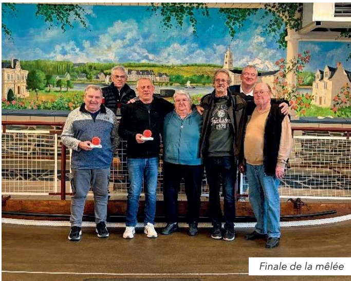
Finale de la mêlée