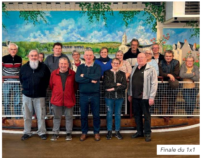
Finale du 1x1