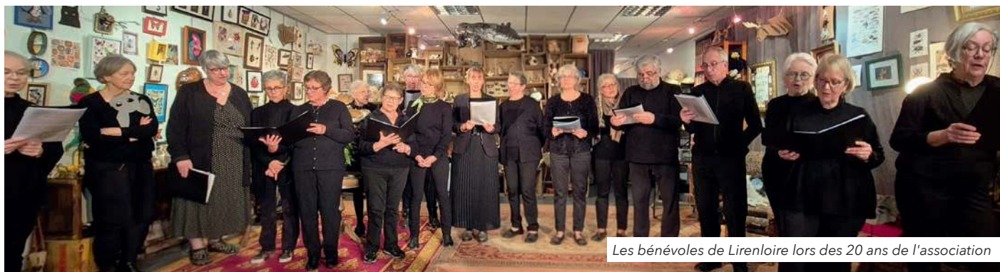
Les bénévoles de Lirenloire lors des 20 ans de l'association

La Médiathèque de La Ménittré est en réseau avec celle de Beaufort !