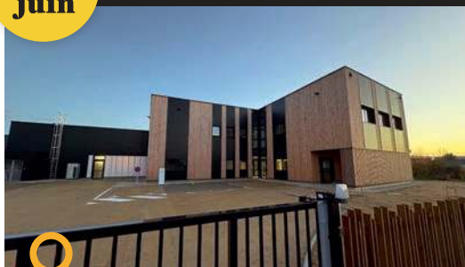
1, rue Louis Lumière - Zone Actival à BEAUFORT-EN-ANJOU